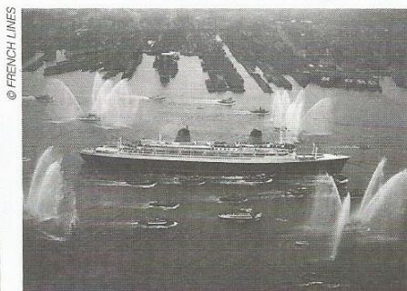
Le France fêté à son arrivée à New York