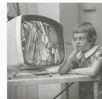
La télévision : une innovation intrigante