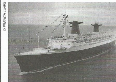
Une prouesse technique.