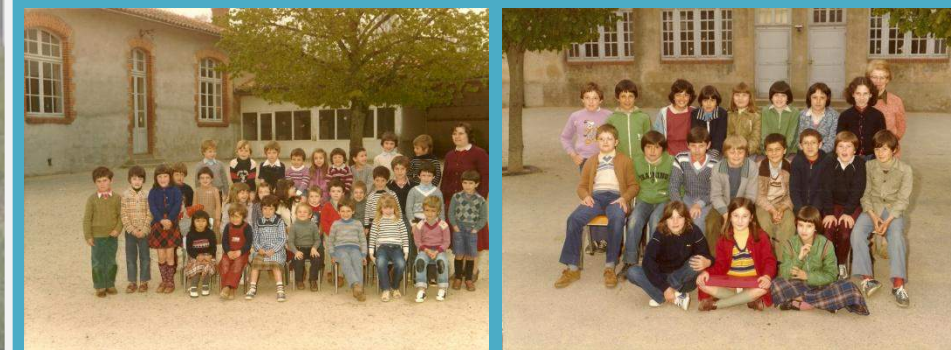
L'école du bas (à gauche) et l'école du haut (à droite) en 1978.

Si dès les premiers temps, les garçons de moins de 6 ans pouvaient être accueillis à "l'école des filles", il faudra attendre 1941 pour qu'avec la création de "l'école des garçons", ces derniers puissent poursuivre leurs études et préparer le certificat d'étude à l'école St Maurice.