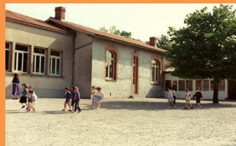
L'école du bas en 1978