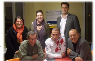
Commission immobilier de l'école

L'histoire de l'école St Maurice est étroitement liée à la générosité des paroissiens, parents d'élèves ou artisans de Moutiers les Mauxfaits. Ce grand projet aura été l'occasion de refaire vivre cette solidarité entre les différents partenaires.