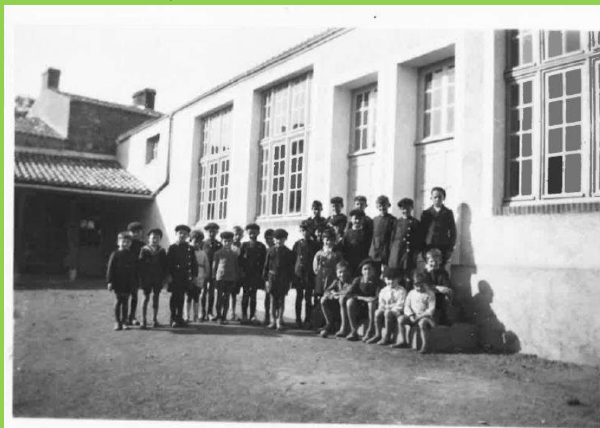
Première rentrée des classes en septembre 1941

Le premier coup de pioche fut donné le 1 er février 1940. A la date de l'ouverture, une seule classe était terminée, faute de ciment et de carreaux pour le dallage. Pourtant, grâce à la générosité de nombreux artisans, l'essentiel était terminé au début de l'été 1941.